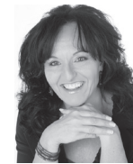
Christina Weigl Training & Coaching GmbH www.christina-weigl.ch

Neben fehlender Wertschätzung sind Stress und negative Emotionen die grössten Killer von Freundlichkeit. Beim Herzen funktioniert ein ähnlicher Informationstransfer wie bei Radio- oder TV-Sendern. Ton und Bild werden durch elektromagnetische Wellen übertragen. Im Prinzip senden wir ständig Informationen aus, auch wenn wir uns dessen nicht bewusst sind. Diese Emotionswellen – positiv wie negativ – interagieren miteinander. Somit sind das Fokussieren auf das Herz, Emotionsmanagement und Herzintelligenz lernbar und langfristig lohnenswert.